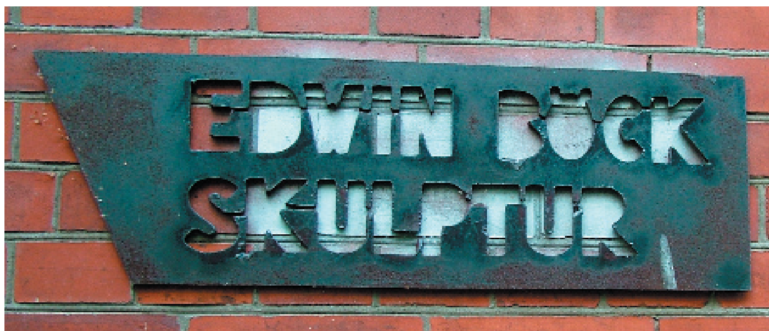
Skulptur, javisst, i till exempel snö. Men så mycket mer. Edwin Böck jobbar också med eld, betong - och tid. Bland annat.