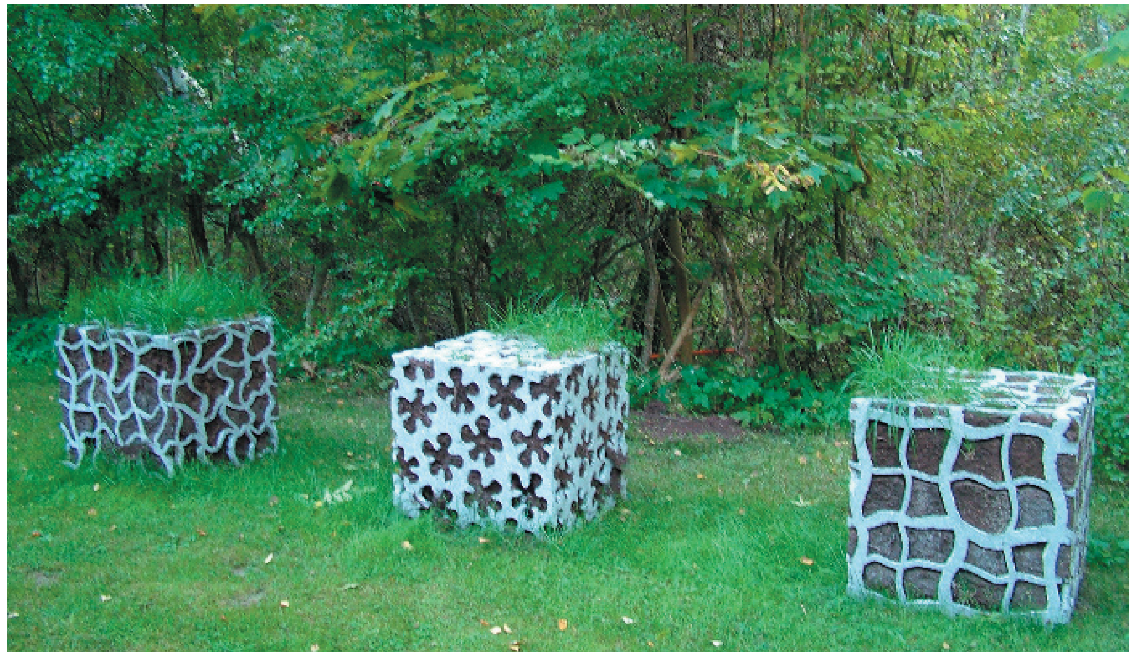
Lantbrukarsonen Edwin Böck låter gräset växa upp ur betongen.